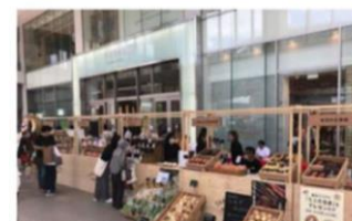
※写真は過去のフォーラスマルシェ